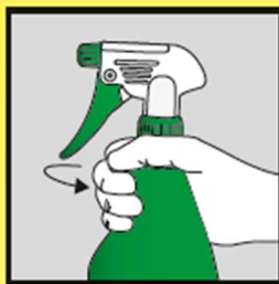
Verschluss gut zudrehen.