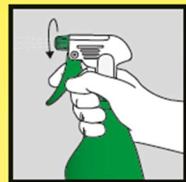
Sprühdüse aufdrehen und Pflanze besprühen.